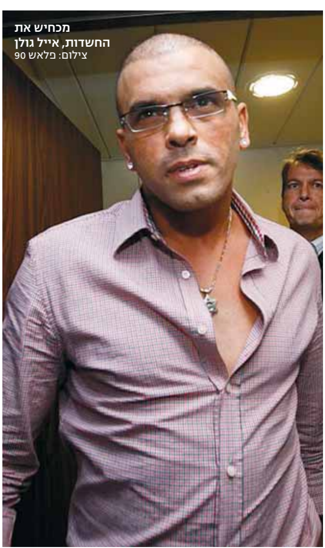
מכחיש את החשדות, אייל גולן

הנה לנו אדם שלפני שנים עזב את משפחתו ואת ילדיו כדי שיוכל לעשות לעצמו ולחבריו מסיבות חשק על בסיס יום-יומי, שבהן בנות ישראל מוזמנות לענג ולברר אותו כנתיחי בשר עובר לסוחר, כדי שיוכל להמשיך להיות סוחר פזמונים של אהבה. איך אנחנו יכולים להיות עם הצביעות הזאת שלנו וממשיכים לצרוך את אותם פזמונים של אהבה, שלו ושל חבריו, שכבר מזמן היה ברור שלא האהבה דיברה בהם, אלא שעמום קיומי עמוק ולב גס? כי גם אם מחקירות המשטרה יתברר שלא הייתה עבירה על החוק ושאינו עילה להגיש כתב אישום נגד הזמר והחברות, והרי כל הפרשה הזו מסריחה עד השמים.